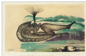
Le Voyage - 1959

Jusqu'au 25 février 2024, Passages, exposition des œuvres de Thierry Pécastaing (1953-1995)